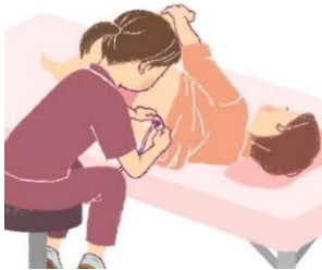
胎盤を自然に剥がれ落ちるのを待つ