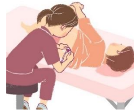
ولادت بدون درد