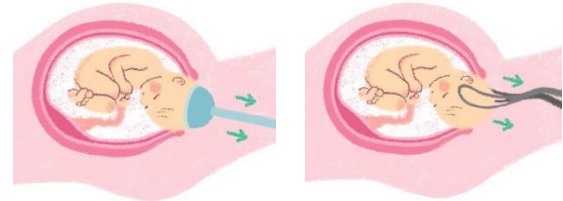
ولادت با سکشن