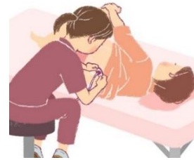
ولادت بدون درد