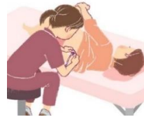
Persalinan tanpa rasa nyeri