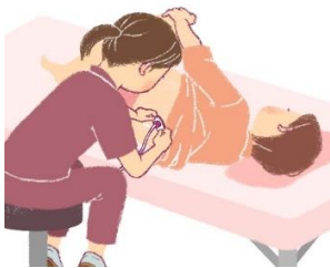
むつうぶんべん 無痛分娩