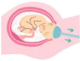
きゅういんぶんべん 吸引分娩