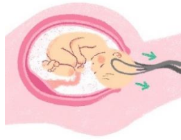
かんしぶんべん 鉗子分娩